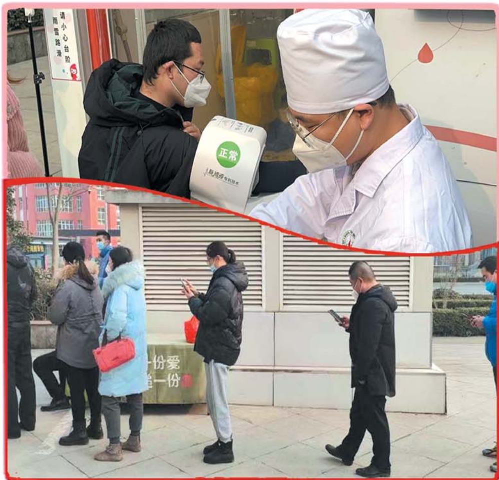
从临沂赶到济南的邻居们排队献血。