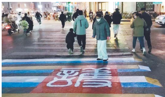
济南洪楼广场附近新设的立体斑马线吸引市民驻足。

据介绍,立体斑马线所在位置距离闵子骞祠很近,闵子骞因“芦衣顺母”而成名,在经过一个月的商讨后,设计团队最终决定结合“孝文化”,以“守护”作为主题。“大家看到斑马线上喷绘的小篆‘守、护’二字就是这个含义,四个路口代表了‘守护安全、守护生命、守护平安、守护畅通’。四个‘守护’时刻提醒着人们注意行车安全。”郑莎莎说。