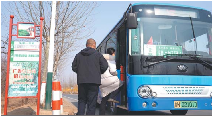
坐公交车不花钱,给当地市民带来了实惠。

2月6日,在乐陵客运总站,公交车进进出出,前来乘坐公交车的市民络绎不绝。“因为公交车免费,客流量增加十分明显。以前一天的客流量为3000人,今天增加了30%—40%。”乐陵市公共交通有