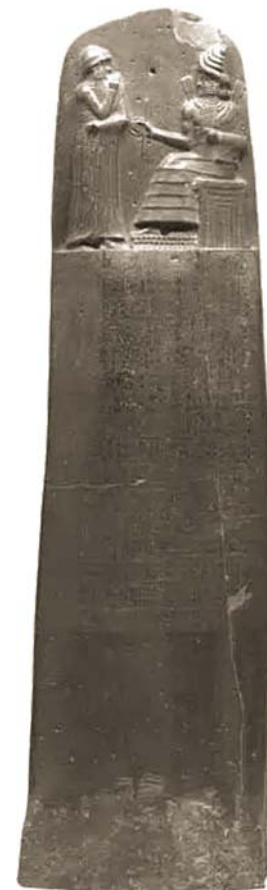
▲《汉谟拉比法典》石柱