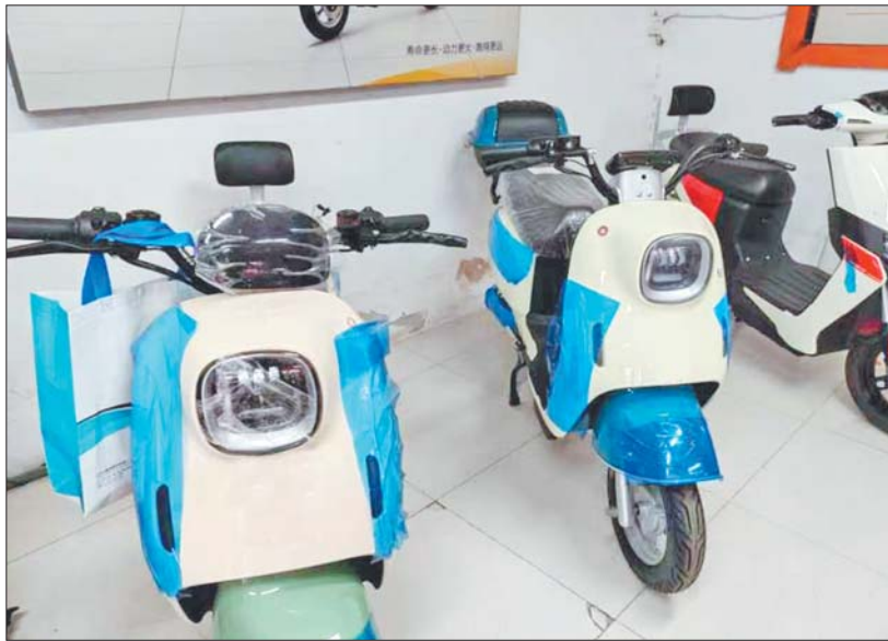
位于济南市天桥区的电动车大世界内,某电动车专卖店里摆放着改装后的电动自行车。

2月19日,本报以“先挂牌再改装,电动自行车前后‘两张脸’”为题报道了电动自行车挂牌的乱象。20日,有市民报料称,自己购买的某款电动自行车都没有拆回合格证上的样子,商家就直接给挂上了绿牌。济南车管部门称,如果情况属实,将取消商家带牌销售资质。