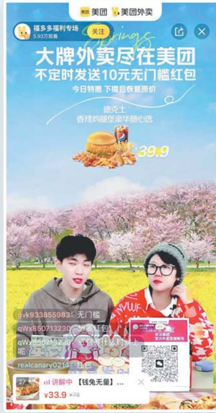
美团所推外卖直播。