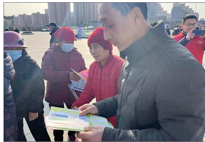
向居民发放垃圾分类宣传手册。

本报2月23日讯(通讯员卢童) 为进一步深化垃圾分类工作落实，持续做好生活垃圾分类宣传培训工作，营造人人参与垃圾分类的良好氛围，2月15日下午，济阳区城管局联合济北街道办事处在济阳安大广场组织开展垃圾分类主题宣传周启动仪式。