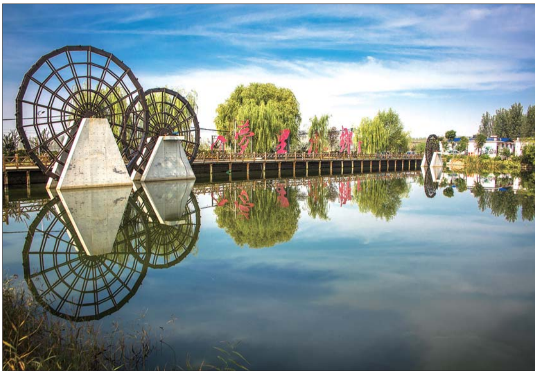
如诗如画的大李庄村如今已成为了喻屯镇的美丽乡村示范片区。

行打造。结合滨湖特色，开发水上娱乐、捕捞、垂钓等项目，体验独具特色的水乡文化。同时，打造文化体验区，充分展示喻屯历史和文化，并宣传特色农产品。