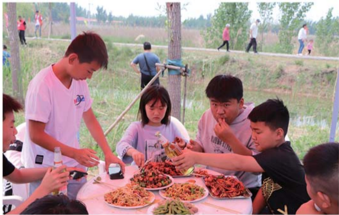
游客们在生态园品尝喻屯特色小龙虾美食。