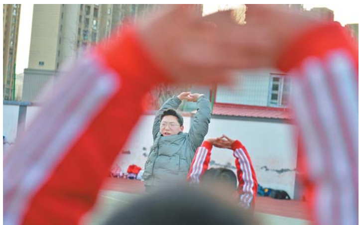
孔德意很享受跟孩子们一起练武的时光。