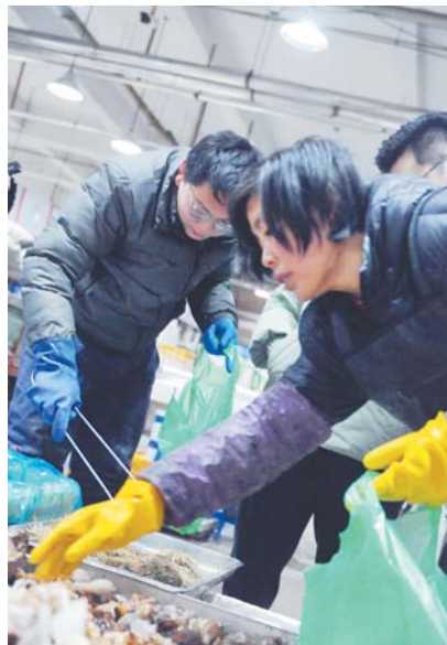
海鲜市场的生意让孔德意要从夜里11点忙碌到第二天早上6点才收工。