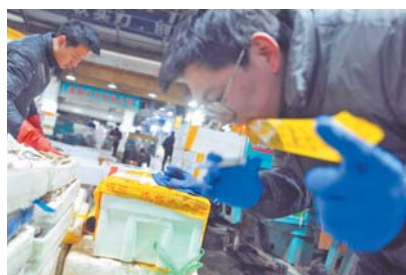
如今,他已是海鲜市场里的“老手”。