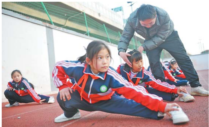
他特别注重孩子们基本功的训练。