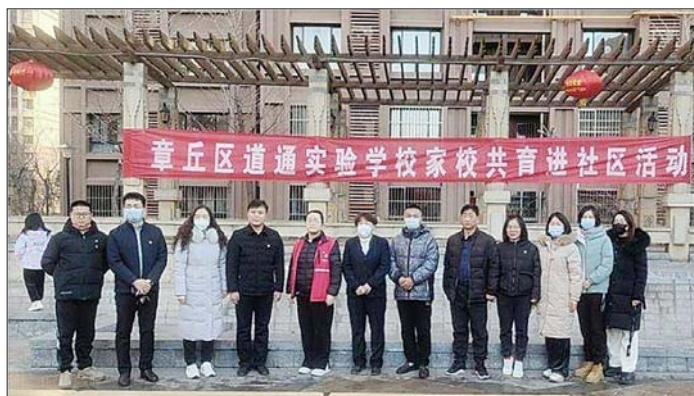
整合社区与学校教育等资源，解决了困扰很多家长的“四点半难题”。

为提高基层治理能力，加快建设美好家园，双山街道坚持以“社区治理合伙人”工作模式，统筹多方资源，搭建工作平台，通过跨行业、跨领域、跨实体社会主体的多元叠加，形成各方参与、多元共治工作格局，不断释放共建共治共享的社会红利。