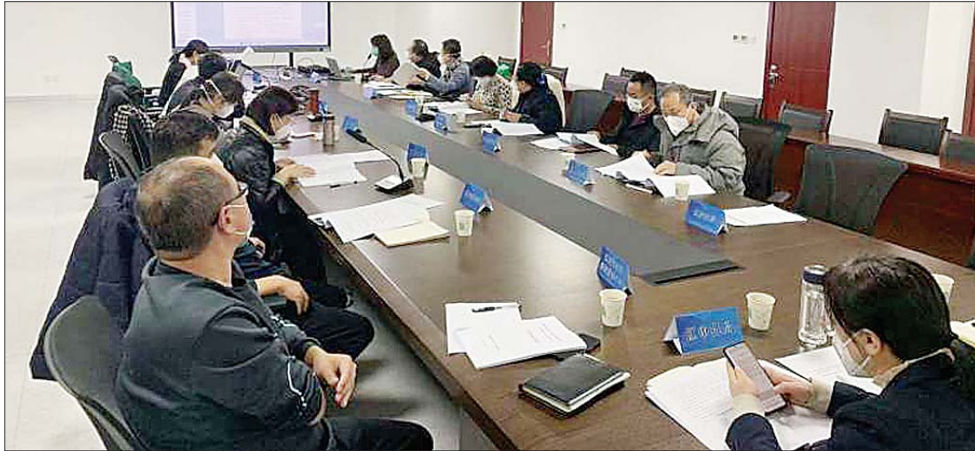
项目一次性通过率由之前的50%提升到了80%以上。

在项目建设过程中，专家评审一直以来因事项类型多、一次性通过率不高等原因，是制约项目进度的一大痛点和难点。针对这一情况，章丘区行政审批服务局坚持问题导向，通过对专家评审事项详细梳理、有机整合，推动各类专家评审项目“能并则并、应串尽串”，为项目建设提质增效保驾护航。