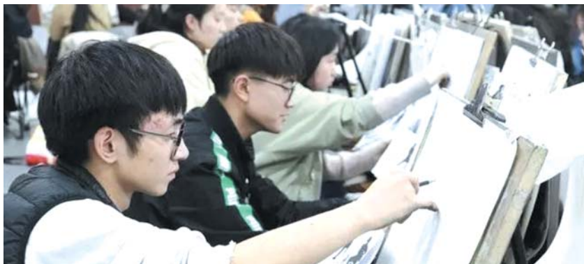
潍坊一家画室的艺考生备战艺考。(资料片)

14年前,山东实行了美术类专业省级统考,美术也成为全省首个开启统考的艺术类专业。2023年3月29日,随着省招考委一纸政策的发布,原美术类专业被重新更名,高考文化课占比及考试时间也将发生重大变化。