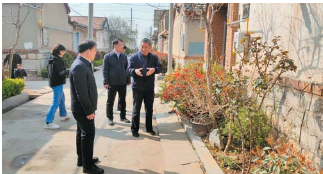
寨里镇主要领导带队督查指导人居环境突出问题排查整治工作。

督查组先后到陈大下、魏王许、边王许、赵官庄、苏坡、公王庄等10个村,通过实地查看、走街入巷、现场反馈等方式,认真查看了各村在农村人居环境整治方面存在的问题及整治成效,逐一听取了包村干部的整改汇报及村支部书记的工