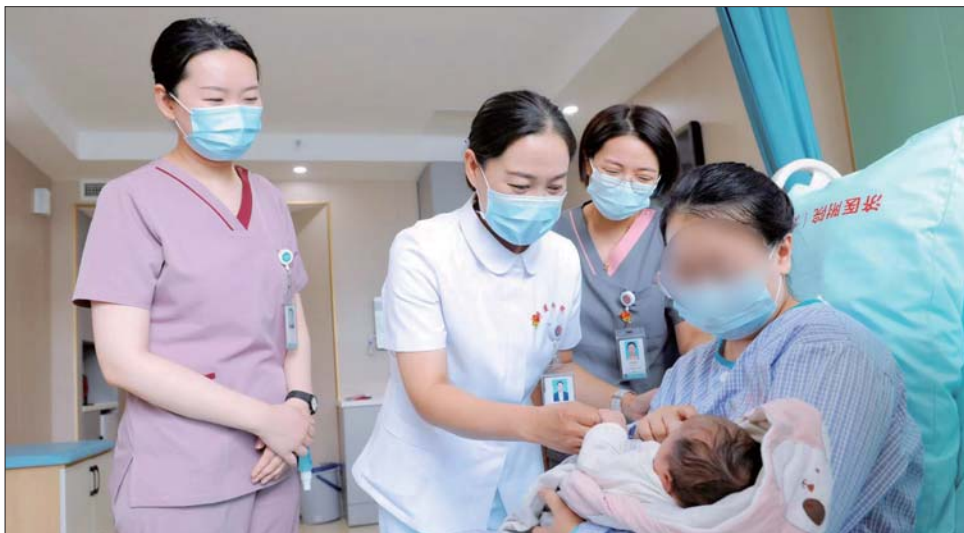
济医附院积极探索临床路径管理，减轻患者就医负担。

随着医院日间手术的普遍开展，医院推进基于临床路径的日间手术管理模式，于2015年加入了中国日间手术合作联盟(CASA)，成为山东省首家CASA会员单位。医院实行日间手术临床路径管理，将日间手术管理纳入临床路径管理绩效考核体系，截至2022年底，共完成临床路径管理下的日间手术8万余例，有效减轻了患者就医负担，改善了患者就医感受，提高