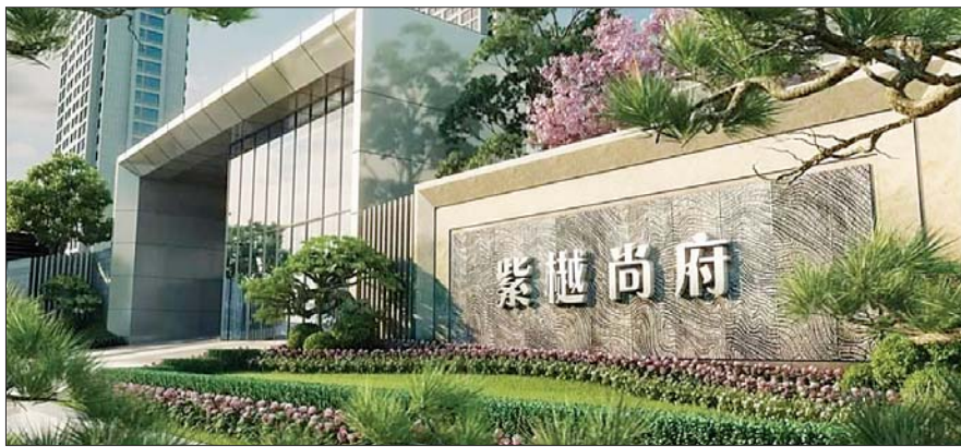
置业顾问承诺的交房时间一再拖延。

2021年买房时置业顾问承诺2022年底交房,到了去年底又说今年3月肯定交付,3月过了又推到4月底最晚5月初……日前,青岛崂山区紫樾尚府业主反映,由青岛北泰置地开发的紫樾尚府承诺的交房日期一拖再拖。因为该区域属于热点片区学区房,入学需要提前一年落户,业主们质疑:卖房时承诺的今年落户明年上学能实现吗?