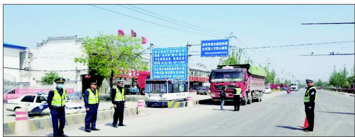
针对货运车辆交通违法行为突出的实际,枣庄市公安局交警支队在全市部署开展为期一年的货车交通违法行为集中整治行动,建立摸排数据、动态监控、联合惩治、警示曝光等8项措施,稳步推进整治行动规范高效开展。

截至目前,开展全市统一行动2次,查处货车各类交通违法行为5653起,涉及货车交通事故同比下降64.3%,取得良好战果。图为4月6日夜至7日,薛城交警大队联合交通综合执法大队开展货车超限超载整治行动。