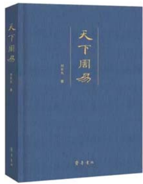
《天下周易》 刘长允 著 齐鲁书社

哉。掩卷之际，不得不钦佩刘长允先生治学之严谨，为文之畅达，学识之广博，释经之独到。刘长允是研究型学者，他幼承庭训，遍览古籍，交游贤达，知识广博。因此，他的《天下周易》不落窠臼，独出机杼。他站在易学千年发展史和传播史的高度，溯源析流，爬梳百家，在《周易》与辞书的关系、易医同源相通、易学海外传播、易学发展前景等方面提出诸多新论与创见，既是对古老易经的经典阐释，又是对于易经现代传播的独特研究。他的释义条分缕析，循古出新，令人信服。同时，他的行文轻松自在，穿插典故轶