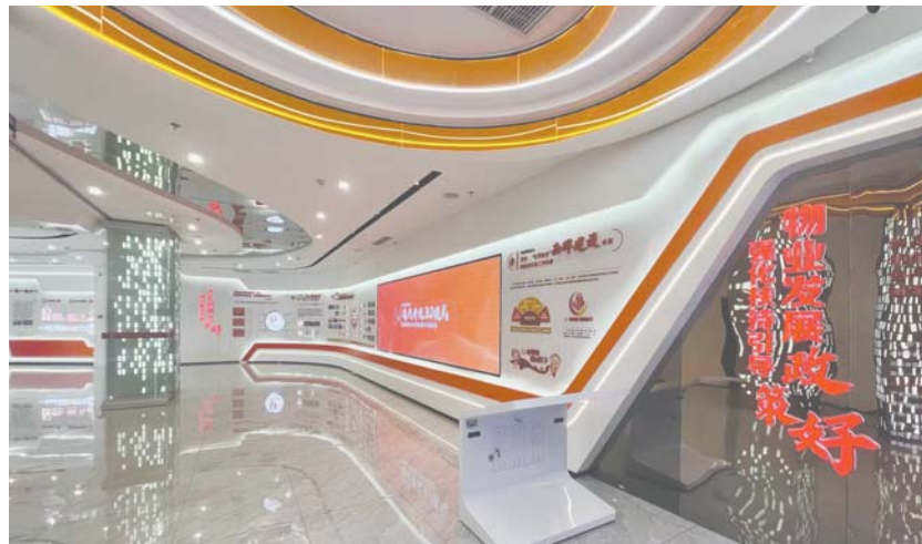
历下区推出系列物业产业扶持政策。

“园区作为历下区聚力打造的物业全产业链园区,将利用优势条件,结合发展目标和任务,充分用好政策资源,为更多的优质物业企业提供全方位的配套服务,推动物业行业上下游企业集聚、集群发展。”园区相关负责人表示,通过一系列的服务和措施,将真正做到企业安心发展,政府提供政策引导,园区负责筑巢引凤,切实扩大物业产业覆盖服务范围,将历下区打造成为全国物业产业高质量发展首选之地。