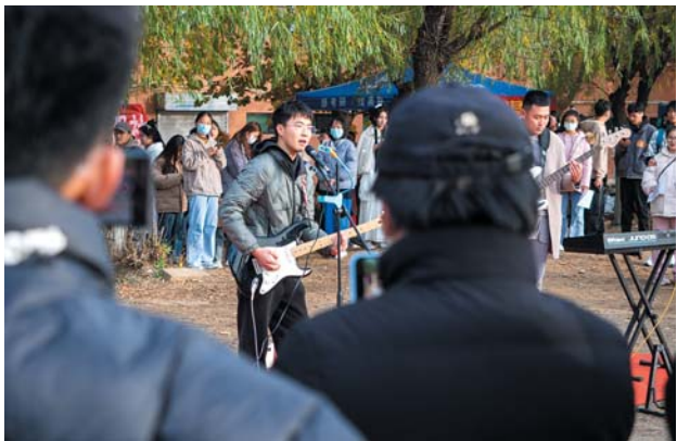
2022年11月13日,学校社团开展“百团大战”纳新展示活动。

摄影使我用心地观察生活,留心生活中的点滴小事,它让我更多地了解同学们的学习与生活,增进了同学间的情谊。我想,这可能就是纪实摄影的魅力。