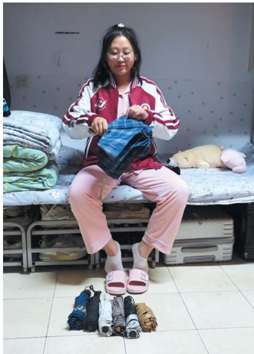
▲2022年10月6日,同宿舍热心同学为大家仔细收起雨伞。