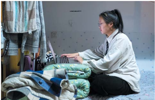
▲2022年11月13日,周末晚上11点还在宿舍学习的同学。