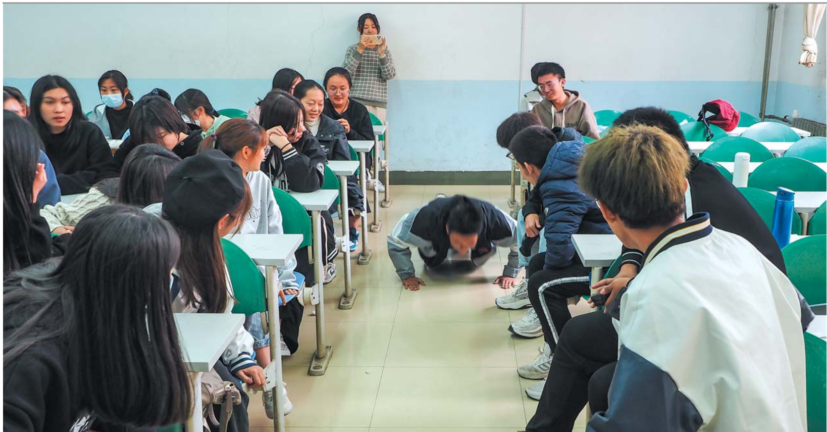
▲2022年10月26日,山建大商学院的同学们在做“心理破冰活动”游戏,输了的同学被罚做俯卧撑。