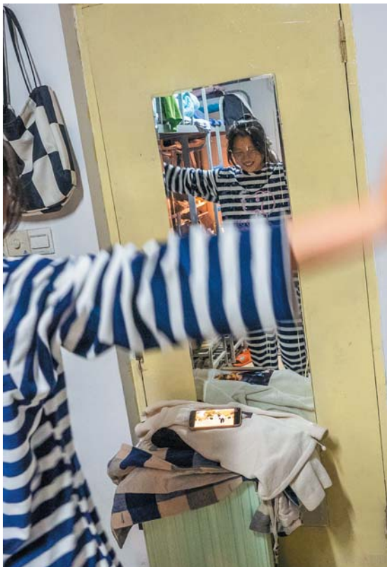
▲2022年11月19日,舍友在宿舍看着手机学跳舞过周六。