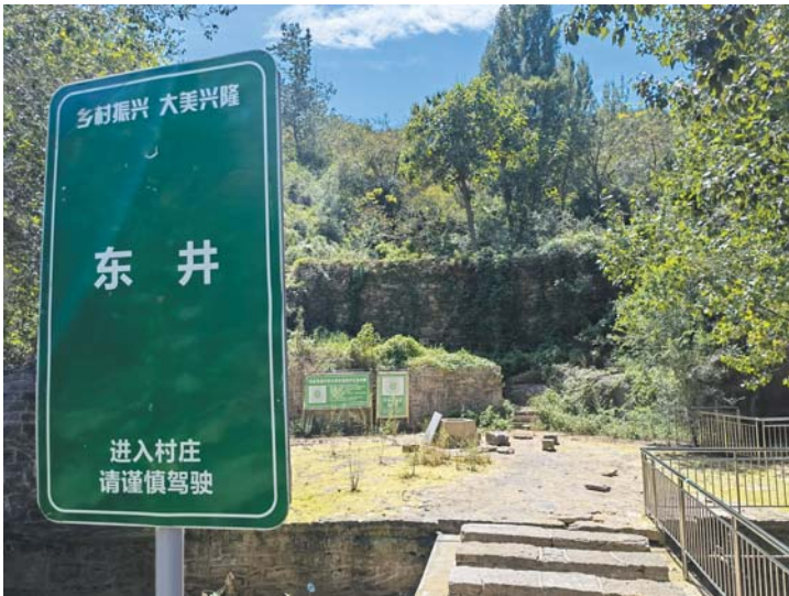
▲ 郑家窝坡村的东井。

而来,到2009年已经传承至14代,至今也有近三百年的历史,当时村里刘氏有53户,203口人,为村中第一大姓。