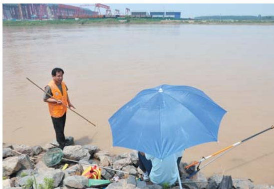
巡河发现有青年在钓鱼,上前提醒注意安全。