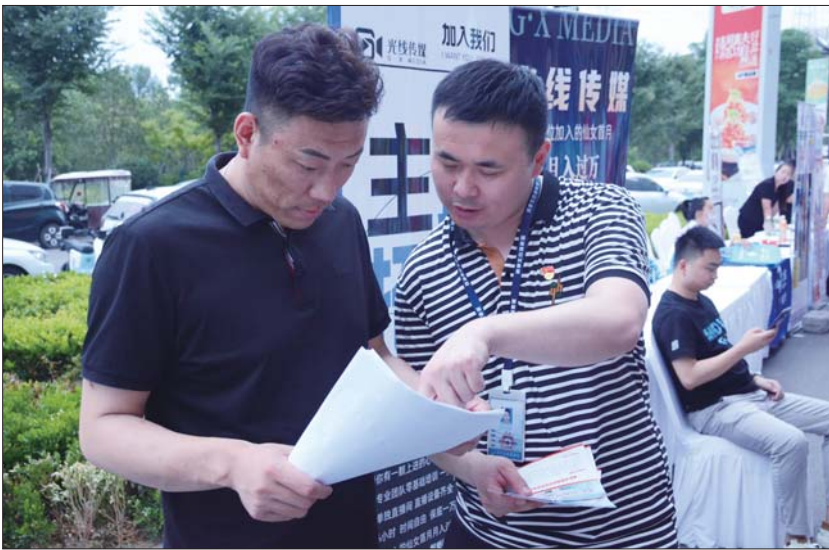
工作人员现场讲解政策。

长期以来,投标人缴纳投标保证金是工程建设类项目招标活动的惯例,而企业因缴纳投标保证金导致大量资金被占用,且占用周期长,一些中小微企业为了多投标不惜向银行