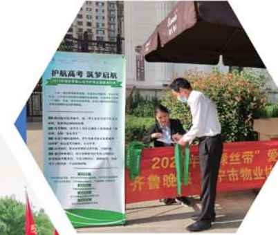
助力“绿丝带”爱心送考。