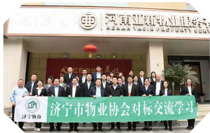
开展对标游学活动。

影进社区等各类党建活动。积极推动各小区打造红色物业示范点，有效扩大红色物业覆盖面，近年来，3家物业企业、8个物业项目被认定为全省“齐鲁红色物业”星级服务企业和星级服务项目。