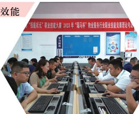
技能大赛理论考试。

加强行业标准化建设，先后开展了《物业服务档案管理规范》《物业服务安全生产基本规范》《物业服务项目经理职业能力评价规范》等团体标准编制工作，以标准化建设促进全市物业服务行业健康发展。