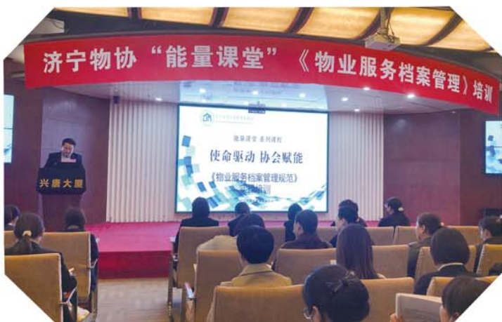
开展能量课堂活动。