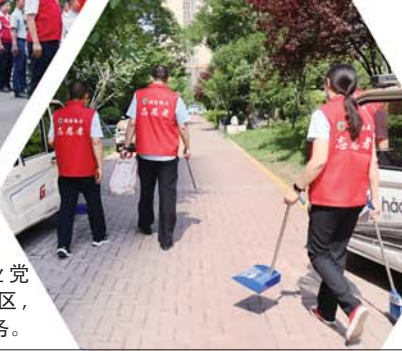
诚祥物业党员干部进小区，开展为民服务。