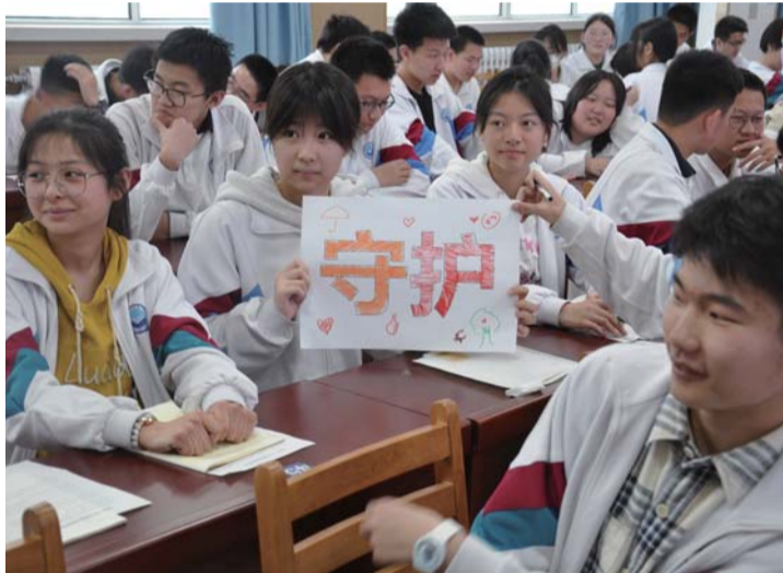
班级心理委员培训。