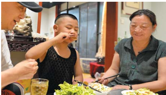
◀小约翰回到家胃口大开。