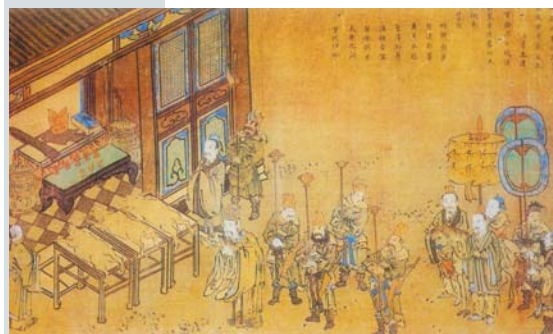
《汉高祀鲁》(明彩绘绢本)