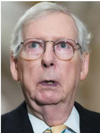
美国国会参议院少数党领袖麦康奈尔