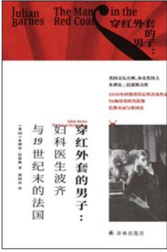
《穿红外套的男子:妇科医生波齐与19世纪末的法国》 [英]朱利安·巴恩斯 著 郭国良 译 译林出版社

日本经济停滞不前已多年,曾经的年轻人靠时代红利完成了财富积累,在职场享受了论资排辈升职加薪的好处,到了退休阶段又有完善的年金制度保证可以安享晚年。然而,当今的年轻人却在生存困境里挣扎,不但无法积累财富,甚至根本找不到稳定工作,不婚化、少子化、失业、啃老、穷忙……日本社会出现的各种问题,都与年轻人的生存困境有关。在本书中,日本社会学家山田昌弘用通俗易懂的语言揭示了当今日本社会年轻人的生存困境、背后的原因,以及衍生的各种问题,最后针对如何应对这些困境和问题,从家庭社会学角度提出了自己的主张。