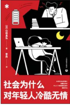
《社会为什么对年轻人冷酷无情》 [日]山田昌弘 著 李燕 译 上海教育出版社

作者在书中描述了大众文化转型的方方面面:新闻业不再忠实报道,转而炒作热点;媒体迎合公众,量产朝生暮死的娱乐明星;观光景点专为游客定制,却又显得千篇一律;营销广告亦真亦假,铺天盖地;文学改编层出不穷,花样翻新……全面观察美国新闻行业发展和变化,系统回顾了公共意识从注重真实转向爱好虚假的过程,准确剖析了大众媒体兴起和技术进步带来的负面影响,内容涉及新闻、选举、旅行、出版、电影、广告等多个领域。本书为20世纪流行文化研究的奠基之作,也是丹尼尔·布尔斯特廷最具突破性的作品之一,一经出版即在学界和社会引发热议,启发《娱乐至死》《景观社会》《消费社会》等多部经典著作。