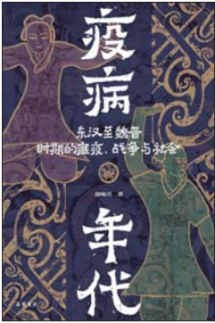
《疫病年代:东汉至魏晋时期的瘟疫、战争与社会》 袁灿兴 著 岳麓书社

进入2000年,县中风光不再,由于地方政府对教育规律的认知误区、条块分割的教育行政体制以及跨区域的生源市场的形成,越来越多非发达地区的县级中学日趋衰败,也挫伤了许多普通民众对儿女教育和家庭未来的信心。县域的教育生态亦被破坏,成为一个问题式的存在。在作者林小英看来,县域教育的生态是复杂的,当县域与地区间的学校不断上演着大鱼吃小鱼的生源与师资争夺,导致了校际差异,也使得退守县中的孩子成为“不被期待”和“不值得投入”的孩子,但他们的命运可能才是最真实的中国底色。