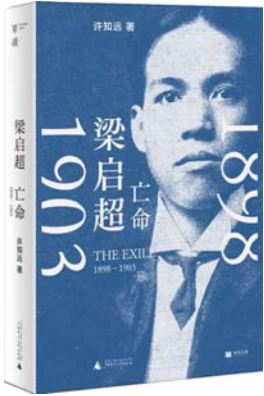
《梁启超:亡命(1898—1903)》 许知远 著 单读 | 广西师范大学出版社