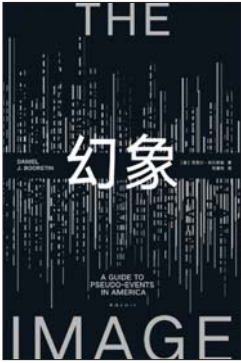
《幻象》 [美]丹尼尔·布尔斯特廷 著 符夏怡 译 新经典 | 南海出版公司

1600年12月31日,英格兰女王伊丽莎白一世授予东印度公司王家特许状,给予它在印度贸易的特权。在100多年的时间里,东印度公司从一个商业贸易企业变成印度的实际主宰者,不仅从事贸易,还拥有军队,在将势力扩张到整个南亚次大陆后更是对其进行殖民统治。然而,权力变大之后,它对英国的政治体制也进行了侵蚀,一些正直的议员对其发起了挑战和限制。而在印度,东印度公司的残酷剥削以及对当地宗教信仰和社会文化的漠视,导致于1857年爆发了席卷印度全境的兵变行动。1858年,它最终被解除行政权力。本书讲述了东印度公司在印度的历史,审视了公司如何对政治,以及政治如何对公司施加影响,考察了权力和金钱如何滋生腐败,以及商业和殖民化的方式为何以及如何总是步调一致。