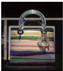
“DIOR LADY ART #4”艺术家限量合作系列王光乐合作款手袋。