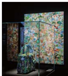
“DIOR LADY ART #6”艺术家限量合作系列张洎合作款手袋。