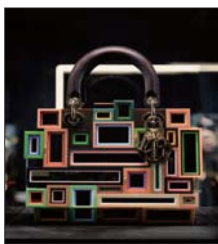
“DIOR LADY ART #5”艺术家限量合作系列宋冬合作款手袋。