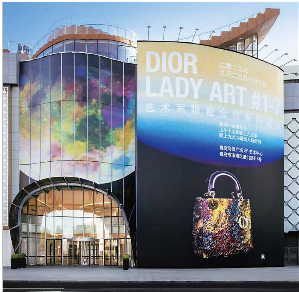
2023年青岛“DIOR LADY ART #1-7”艺术家限量合作系列展览。

2023年9月1日,“DIOR LADY ART #1-7”艺术家限量合作系列展览于青岛海信广场盛大启幕,并从9月2日至10月6日对公众开放。此次展览旨在聚焦LADY DIOR手袋的光辉历程与精湛匠艺,将迪奥与艺术之间的不解之缘娓娓道来。