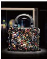
“DIOR LADY ART #2”艺术家限量合作系列洪浩合作款手袋。