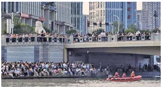
9月2日,天津有关部门增加的水上救援力量在河道巡航。