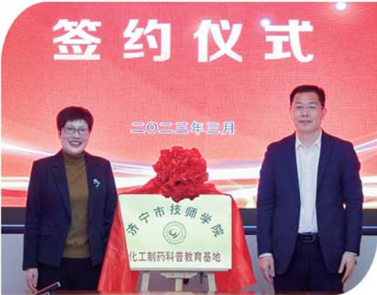
学院化工制药科普教育基地揭牌。