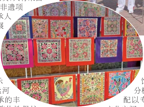
◀ 参展的传统织染绣。

展览创新推出的黄河流域9省“非遗会客厅”，极具地域特色，精彩不断。青海西宁的锅庄舞热情奔放，甘肃兰州的太平鼓铿锵有力，四川成都的川剧变脸精彩绝伦，宁夏银川的山花儿豪放畅快，内蒙古鄂尔多斯格萨尔古韵悠悠，陕西榆林的绥米唢呐激越高亢，山西忻州的北路梆子淋漓酣畅，河南宝丰的光山花鼓戏鲜活传神，山东潍坊的诸城派古琴质朴感人……现场掌声阵阵，喝彩连连，赚足了观众的眼球。山东省非物质文化遗产传统织染绣与服饰精品展上，织、