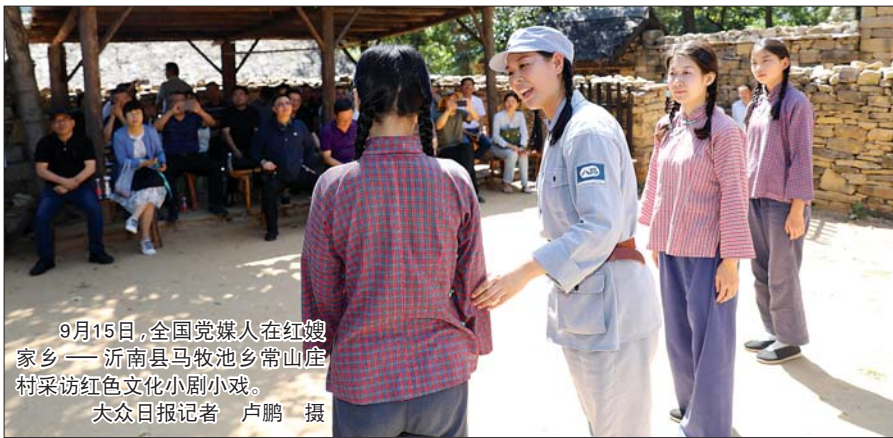
9月15日,全国党媒人在红嫂家乡——沂南县马牧池乡常山庄村采访红色文化小剧小戏。

一张红色报纸,燎原齐鲁大地。参观大众日报创刊地,广西日报社(广西日报传媒集团)出版部副主任唐群峰很受触