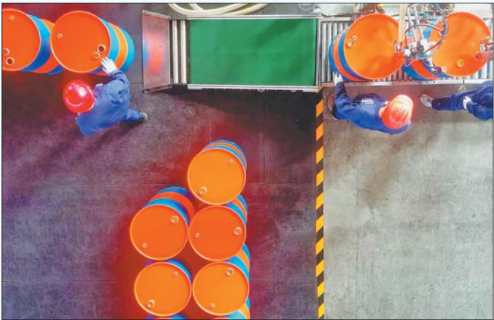
山东迈拓凯尔新材料科技有限公司车间内工人正在搬运产品。