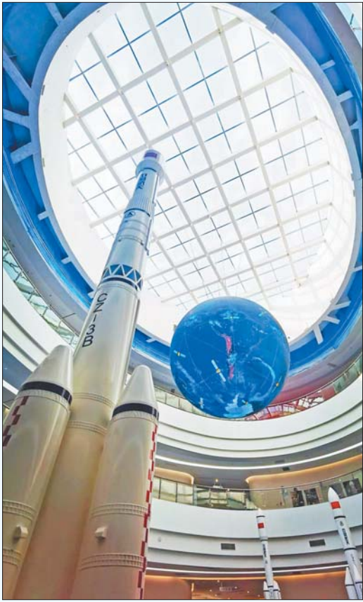
海阳卫星数据产业园内矗立的火箭模型。