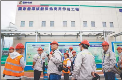
今年年底的供暖季,海阳核能供暖区域将达乳山。

“优无止境 赢在烟台——发现营商环境亮点”中国晚报主流媒体聚焦烟台融媒行由中共烟台市委宣传部和烟台市委营转办联合中国晚报摄影学会、山东省新闻摄影学会、齐鲁晚报·齐鲁壹点主办,活动邀请全国晚报主流媒体的总编辑、记者、摄影大咖等20余人走进烟台,用他们的视角,全方位、多角度发现挖掘烟台市优化营商环境工作亮点,持续扩大烟台城市知名度、美誉度。