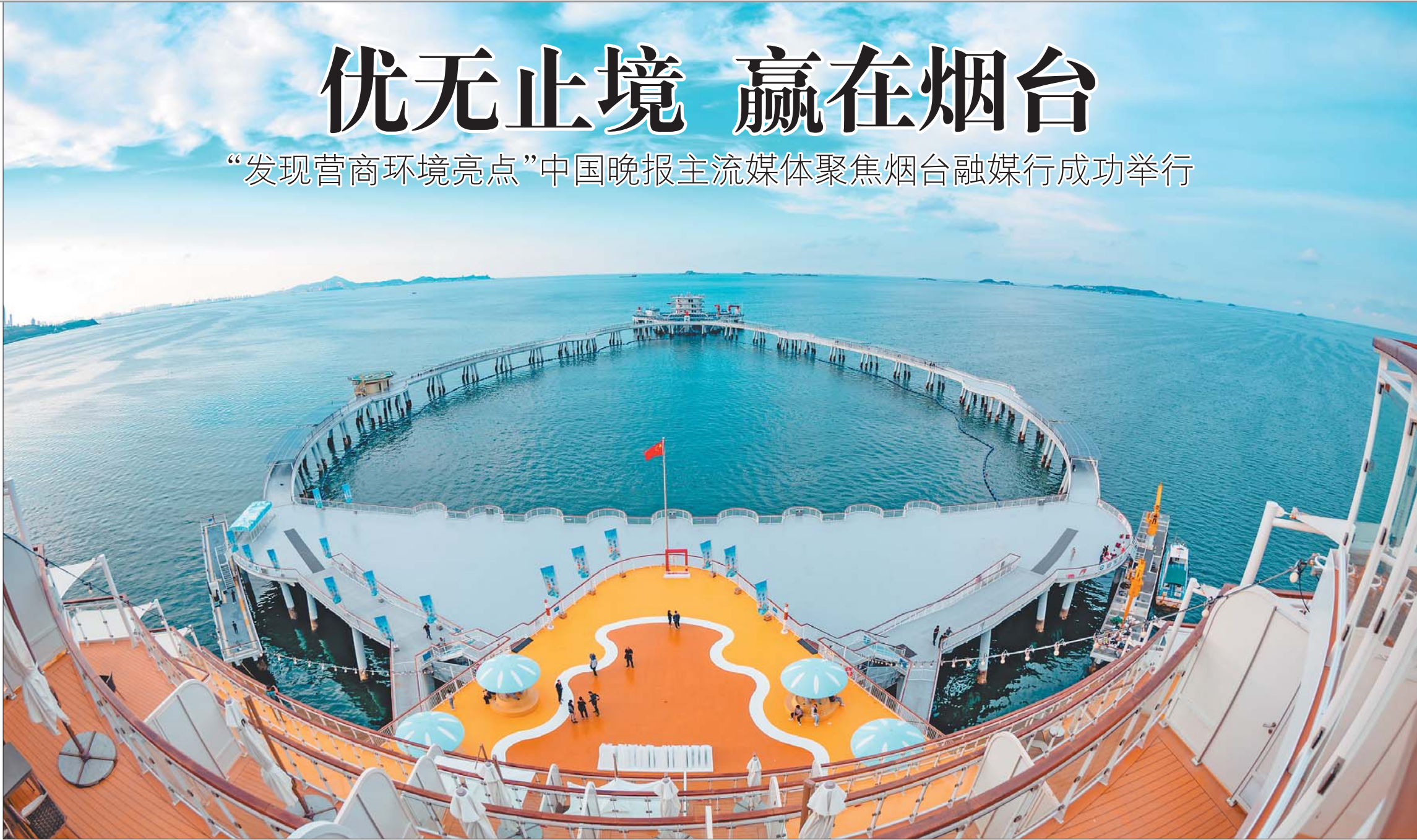
全国首个智能化大型生态海洋牧场综合体平台“耕海1号”。