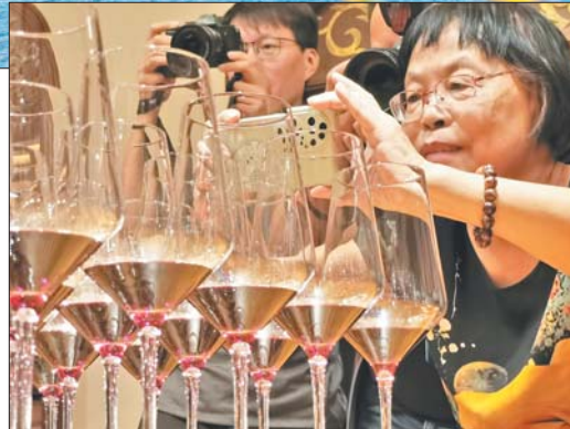
蓬莱丘山谷安诺酒庄内葡萄酒品鉴。