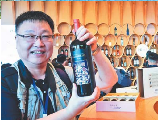
融媒行记者展示产自蓬莱丘山谷的葡萄酒。