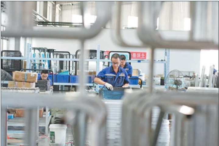
龙口市永安车窗有限公司车间内工人正在组装配件。