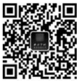
西泠拍卖官方微信

西泠拍卖杭州总部及北京办事处、上海办事处常年征集藏品，欢迎各地藏友前往交流，分享收藏心得。还可关注西泠拍卖官网、微信公众号“西泠拍卖”、新浪微博“西泠印社拍卖”了解更多信息。