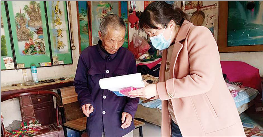
网格员入户探访老年人。

为做好全镇留守老人和分散供养特困人员等老年人群关爱服务工作，怀仁镇链接资源，坚持全面统筹、重点保障，引导、支持各方面力量，开展多元化探访关爱活动，不断创新探访关爱养老机制。 一是打造引领方阵，筑牢红色根基。强化党建引领，依托“怀仁先锋 五联工程”党建品牌，充分发挥基层党组织、党员先锋模范作用，不断完善镇党委、村党支部、胡同长组织结构体系，对全镇33个行政村，58个网格，组建由网格员、养老组织、胡同长、家庭医生构成的关爱行动小组，统筹好各类探访服务工作。 二是打造联动平台，汇聚多元力量。深化拓展关爱老年人工作格局，链接第一书记、规模企业、两新组织、社会工作者、文艺剧团等志愿服务资源，对探访老年人的住所环境、身体状况、及心理慰藉需求，开展定向服务活动。并针对农村留守老人较多的情况，建立网格员与老年人子女沟通联系机制，督促子女履行关爱义务，形