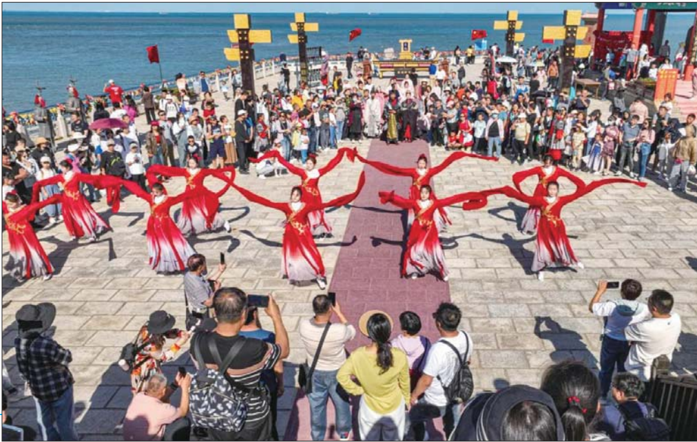
国庆假期威海市西霞口景区。

2023年的中秋节和国庆节前后相连，形成了调休后的8天超长假期，“前半程团圆、后半程旅游”特征较为明显。民众假日出游意愿得到集中释放，中远程旅游实现较高增长，主要旅游目的地及热门景区消费活跃度持续高位运行，旅游需求多样性和个性化并存，“热点更热，冷点不冷”现象突出。文旅行业结合假日特点，通过“旅游+”融合演艺、体育、非遗等，推出一系列体验丰富、备受游客青睐的活动和产品，让假期文旅市场更加精彩。