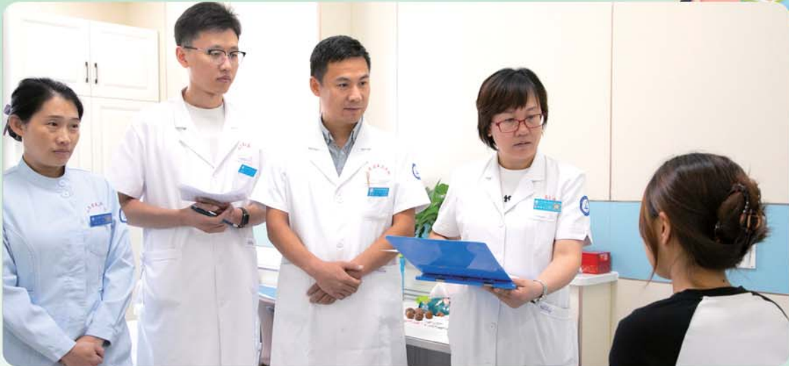
科室以雄厚实力解决儿童青少年心理问题。

目前，科室根据有无家属陪护需求共设立两个病区及强迫症诊治中心、专家门诊、学习困难门诊、青少年心理咨询室。服务内容涵盖青少年抑郁症、焦虑症、强迫症、学校恐怖症等儿童青少年情绪问题，多动症、抽动症、品行障碍、发育障碍、神经性厌食/贪食、儿童期精神障碍等儿童发育及行为障碍，学习障碍、适应性障碍、病理性成瘾、青春期烦恼、亲子关系问题等儿童青少年心理发展中的问题。