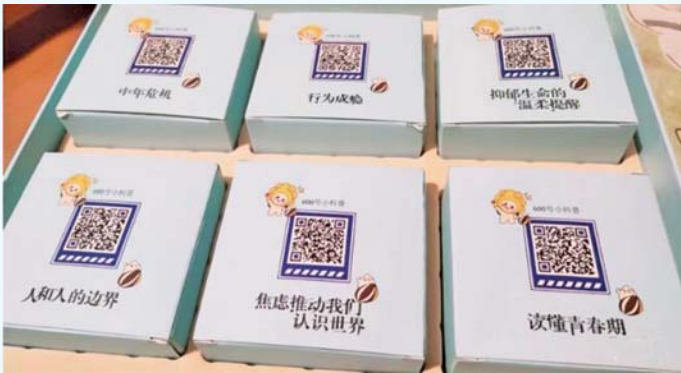
“600号月饼”包装盒背后都有一个二维码,扫一扫即可听到“600号小科普”。