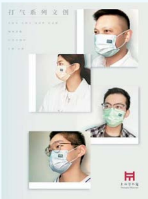
▲上海市精神卫生中心和上海博物馆联名推出的“打气系列”文创口罩。

今年的10月10日,是第32个世界精神卫生日。在针对精神障碍患者的治疗中,除了依靠医学治疗手段,也需要给予病人包容和鼓励等情感支持。