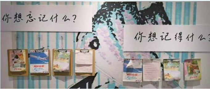
阿尔茨海默病主题摄影展设有“你想记得什么”留言本。

程中,不用一味地追求临摹得像不像,或者仅仅只是完成涂色部分,而是应该画出自己的风格,打破条条框框的束缚。