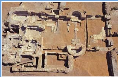
圣伊拉里翁修道院遗址