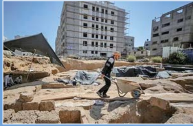
拉法考古遗址现场

Baibars)建造,最初是为了防御十字军和入侵的蒙古军队。1600年,这座堡垒被奥斯曼帝国拉德万王朝接管并扩建。