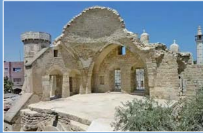
幸存下来的巴尔古堡的一部分