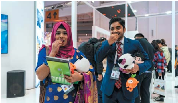
11月17日，两名来自孟加拉国的参展商在2023中国国际旅游交易会上品尝来自新疆的红枣。