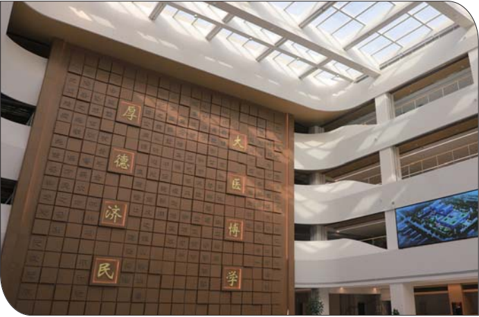
中国中医科学院西苑医院院训。