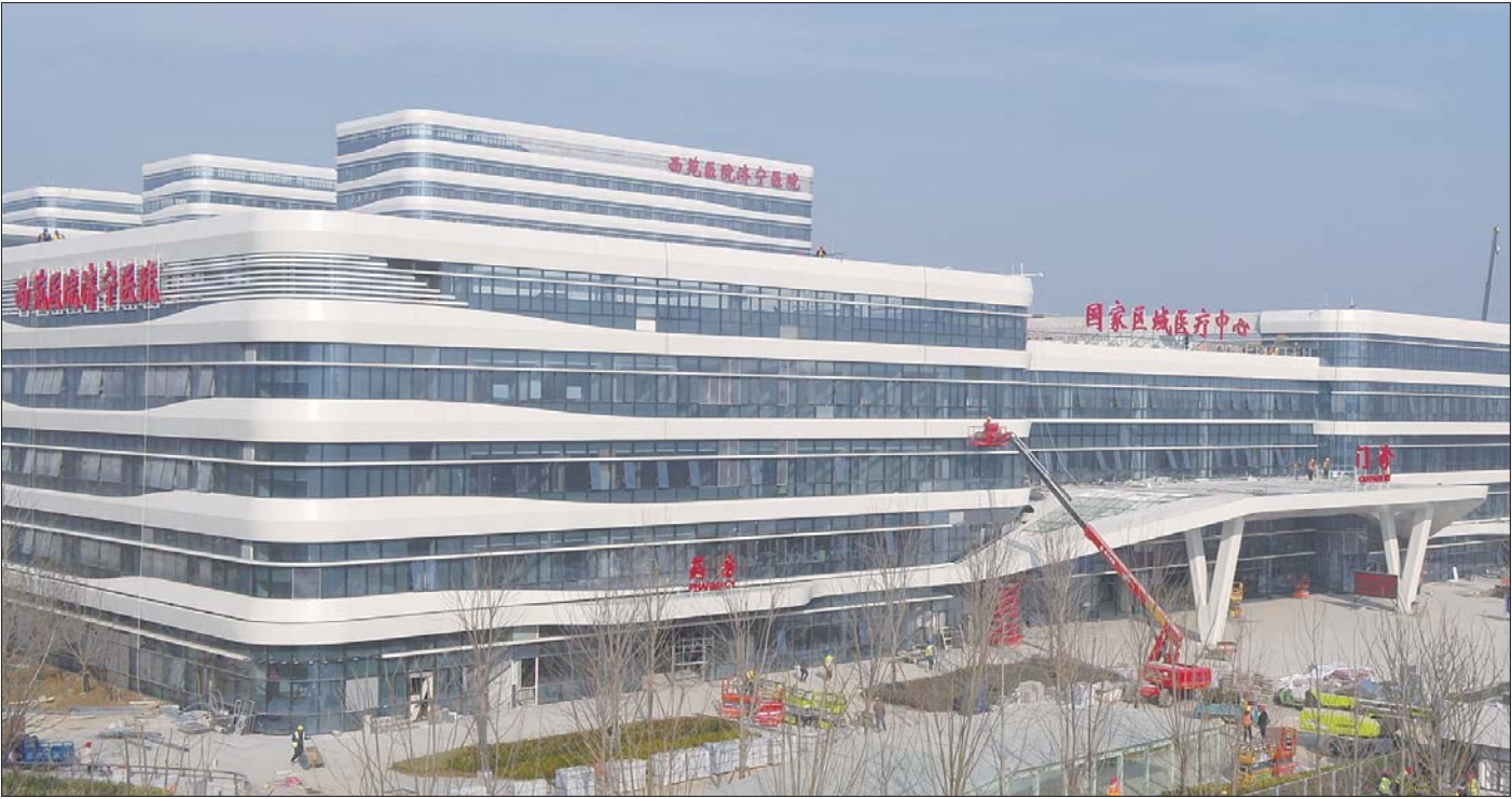
西苑医院济宁医院外景。

在济宁市下半年绿色低碳高质量发展重点项目现场观摩评比中,太白湖新区综合考核名列第六,位于太白湖新区的中国中医科学院西苑医院济宁医院(以下简称西苑医院济宁医院)项目,位列“五佳”项目第一名。西苑医院济宁医院项目是济宁市重点民生工程,也是济宁市与中国中医科学院西苑医院合作共建的国家区域医疗中心,将其作为提升区域医疗救治能力及打造鲁西南中医医疗新高地的重大举措。该项目建筑面积26.1万平方米,主要建设门诊楼、病房楼、制剂中心、科研教学楼、传染楼、国医堂、中医博物馆等,设置床位1300张,预计今年年底投入运营。