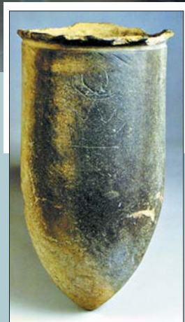
莒县陵阳河遗址出土大口尊