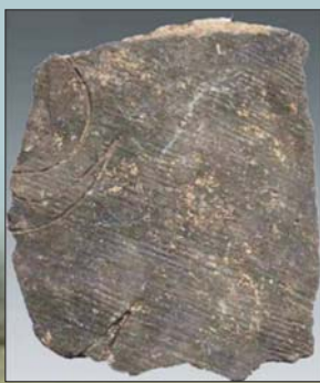
莱州吕村遗址刻有陶文的陶片