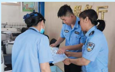
车驾管业务进派出所