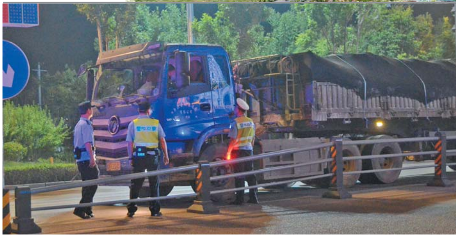
劝离穿城扰民大货车