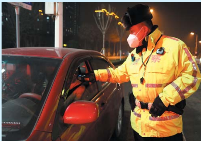
常态化酒醉驾查处

整改安全隐患，筑牢交通安全防线。在责任部门资金困难情况下，交警大队主动牵头协调交通、镇街，合力整改国道突出隐患，推动五个镇街投资200余万元在G220线5个重要路口安装信号灯和电警，推动区公用事业发展中心在银河路安装了4325米中央隔离护栏，规范交通秩序，降低事故风险。全年共排查整改国道省道隐患46处、县省道隐患67处。