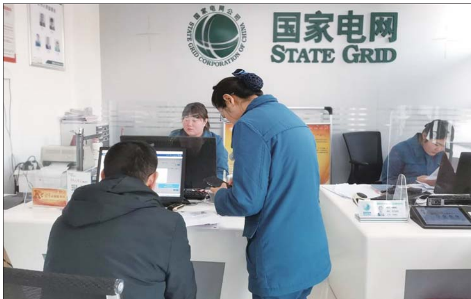
快捷办电，舒心用电。

下一步，太白湖新区供电中心将持续升级优化供电服务，让客户充分体验快捷办电、舒心用电新服务，营造“办电快、成本低、政策优、服务好”的优质电力营商环境，持续助力太白湖新区经济社会高发展。