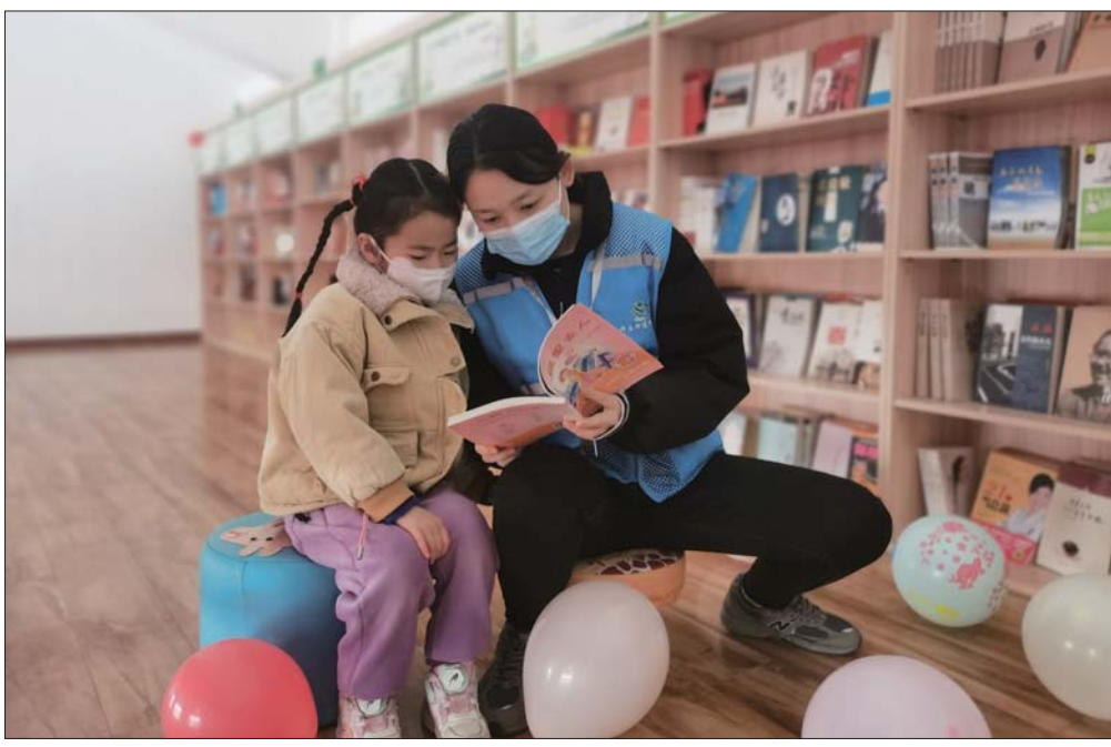
社区成立少年儿童活动室。

据了解，“荷事佬”一站式服务“说事厅”，由社区书记牵头，专职网格员、社区两委成员、物业人员、党员、志愿者组成，根据社区网格精细化管理划分，共划分为5个“荷事佬”工作小组，每周一到周日全天候值班，着力解决老百姓的操心事、烦心事、揪心事。通过建立“群众说事”事项工作台账，把群众诉求条目式管理，分类定责，进行跟踪随访直至解决完成，切实提高群众幸福感和满意度。促进居民服务由“分散服务”向“一站式服务”转