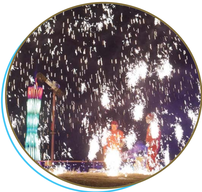
太白湖露营基地打铁花精彩上演。

2月2日晚，一场突如其来的降雪为灯火璀璨的新区平添了几分年味。漫天雪花飞舞，皑皑白雪和明亮的彩灯交相辉映，张灯结彩的热闹喧嚣变得