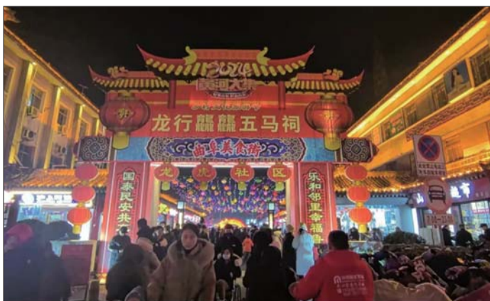
烟火气浓郁的五马祠街。

本报济宁2月22日讯(记者易雪 通讯员 韩歌) 伴随着夜幕降临,曲阜市鼓楼街的数盏花灯同时亮起,引人驻足,在鲁城街道龙虎社区,五马祠街“圣城寻味中国年·龙行龘龘五马祠”黄河大集美食年货一条街烟火气显得格外浓烈。