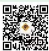
曲阜三孔景区 微信公众号二维码

方式一:打开“曲阜三孔景区”公众号在底部菜单栏中选择“景区服务”,点击“AI导游”购买使用。