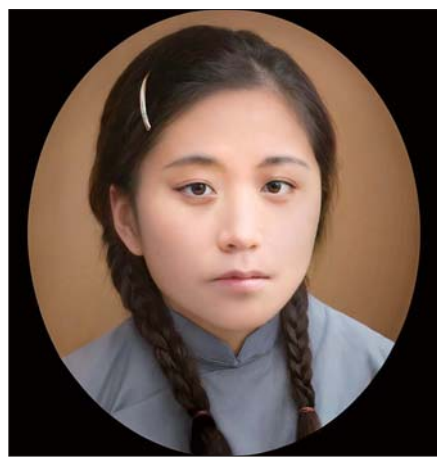
经过修复的女子照片。