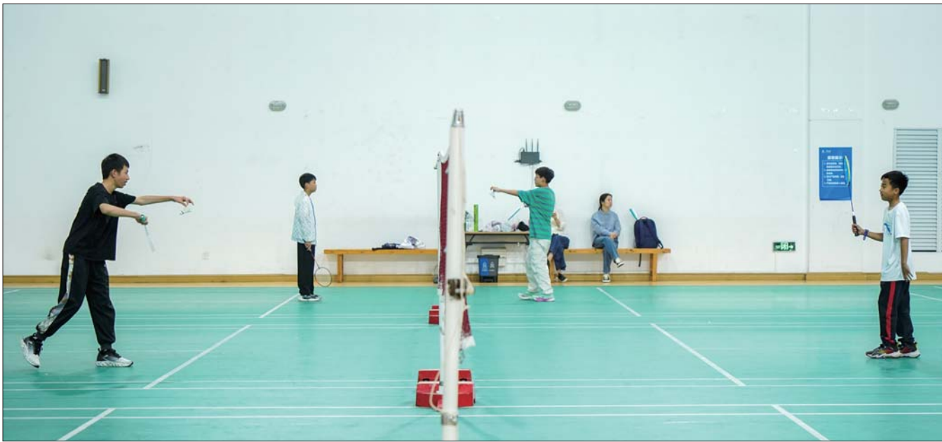
开放的运动场馆备受市民欢迎。

济宁体育中心今年走进建成后的第10年。自2014年作为第23届省运会的主场馆启用以来,逐渐打破以场地出租为主的单一经营模式,通过引入高端赛事、建设青少年培训体系、举办车展和演唱会等措施,推进体育场馆多元化运营,探索出一条城市体育场馆发展的新路子,过去十年累计接待健身市民500万人次,通过市场化运营创新,成功打造成为济宁乃至鲁西南地区的体育文化新高地,为城市的文化体育事业发展注入了新的活力。近日,济宁体育中心运营主体——济宁珠江体育文化发展有限公司荣获“济宁市五一劳动奖状”。